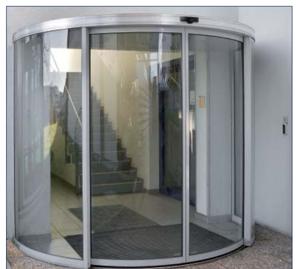
GEZE Technologie- und Entwicklungszentrum

Visoki maska: 150 mm (sa pokrivenim gornjem podnožjem vrata)